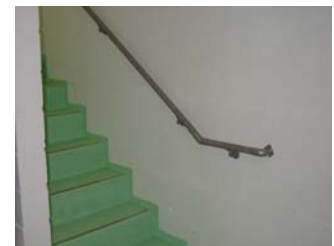
Halterung von unten und 30cm vor Treppenanstang