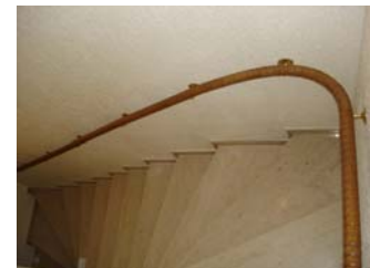
durchlaufend und griffsicher