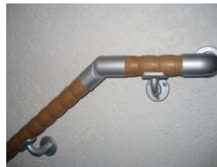
30cm über die letzte Stufe und Abschlussbogen